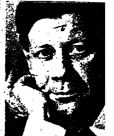
شار المستشار شميدت الى المحادثات اجراها مؤخرا مع مسؤولين سياسيين

الدول العربية والاسلامية قتال انه ، عليه انتباخ بان هؤلاء السياسيين من الصهيونية اكثر خطرا عليه . وادرس انه يدعو ان احلال سلام شامل في الشرق الاوسط ضروري في الوقت الحاضر البنية على ص ٤٨